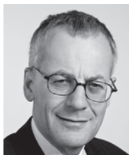
Kurt Fluri, Stadtpräsident und Nationalrat FDP, Solothurn

Die Initiative lässt es zu, dass Volks- und Parlamentsentscheide geltendes Recht aushebeln können. Der Sinn des Verbandsbeschwerderechtes besteht nämlich darin, Gesetzesbestimmungen im Interesse der Natur und der Umwelt dort geltend zu machen und durchzusetzen, wo es keine hiezu legitimierten Privatpersonen geben kann, das heisst namentlich in Landschaften und Naturräumen. Erst seit einigen Jahren verlagerten sich die Konflikte zwischen demokratisch gefällten Nutzungsplänen und den Umweltschutzverbänden hin zu Fragen der Anzahl Parkplätze und der Erschliessung von Einkaufszentren, Stadien und anderen publikums- und damit verkehrintensiven Anlagen. Die Erfolgsquote des Verbandsbeschwerderechtes ist aber beachtlich: Im Jahre 2007 ist es den Beschwerdeberechtigten in 76 Prozent aller Fälle gelungen, Korrekturen zugunsten der Natur vorzunehmen. Ähnliche Prozentzahlen gab es in den früheren Jahren. Dabei ist es eben nicht so, dass alle diese Fälle