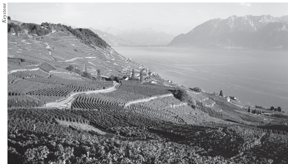
Dank dem Beschwerderecht wurden in der Region Lavaux beim Bau von Erschliessungsstrassen und bei Bauten zur Sicherung des Geländes naturverträgliche Lösungen gefunden.

Genau besehen wird hier das Demokratie-Argument jedoch nur vorge-schoben. Denn Stimmberechtigte und Parlamente entscheiden in der Regel gar nicht über konkrete Bauprojekte, sondern über Kredite oder Sondernutzungspläne. Nach deren Annahme muss zuerst ein detailliertes Projekt ausgearbeitet werden; hernach muss im Baubewilligungsverfahren geprüft werden, ob dieses sämtlichen Vorschriften entspricht. Im Rahmen eines daran anschliessenden Beschwerdeverfahrens geht es normalerweise nicht mehr um «Sein oder Nichtsein» des Projekts, sondern um dessen Optimierung, das heisst um Korrekturen und Verbesserungen. Kein Stimmbürger, der zu einem Kredit oder einem Sondernutzungsplan Ja sagt,