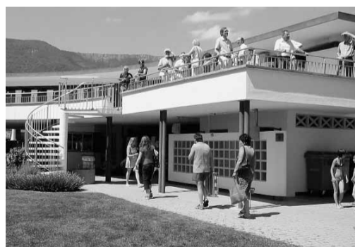
Granges, la piscine de Beda Hefti